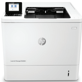
HP LaserJet Managed E60065dn

Esta impresora HP LaserJet con JetIntelligence combina un rendimiento excepcional y la eficiencia energética con documentos de calidad profesional justo en el momento en que los necesita, protegiendo la red con la mayor seguridad del sector. 1