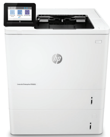
HP LaserJet Managed E60065x