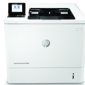
HP LaserJet Enterprise M608dn