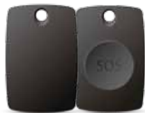
I-ALARM-RFID RFID Tag wireless