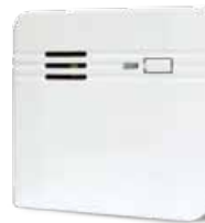
I-ALARM-WATDET Rilevatore perdite acqua wireless