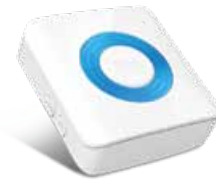
I-ALARM-SIRIN Sirena per interno wireless