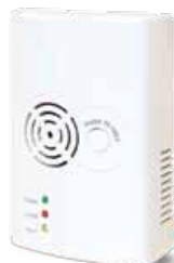
I-ALARM-GASDET Rilevatore gas wireless