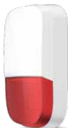
I-ALARM-SIROUT Sirena per esterno wireless