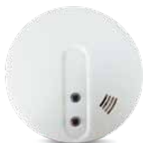
I-ALARM-SMOKE Rilevatore fumo wireless