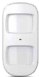
I-ALARM-MOT001 Rilevatore di movimento Pet-Immune wireless