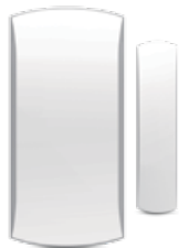
I-ALARM-WIN001 Sensore porta/finestra wireless