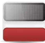
I-ALARM-SIRSOL Sirena per esterno solare wireless