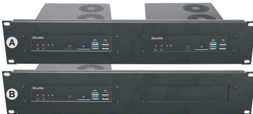
A) zwei montierte PCs B) nur ein PC - plus Abdeckplatte.