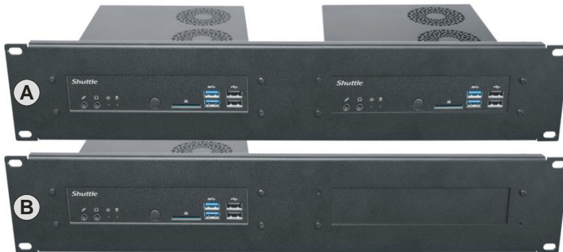
A) zwei montierte PCs B) nur ein PC - plus Abdeckplatte.