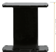
Extender für 2-teilige Aluminiumhubsäulen