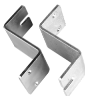
2 verzinkte Wandhalterungen