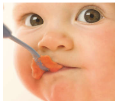
Recipe booklet Nutritious meals made easy PHILIPS AVENT www.philips.com

Apskatiet 12 vecumiem atbilstošas receptes un barošanas ieteikumus atradināšanas periodam, lai jūsu mazulim būtu labs dzīves sākums un izveidotos veselīgas ēšanas ieradumi visas dzīves garumā.