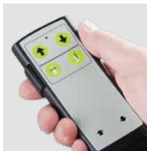
Elektrische Fernbedienung Wired remote control