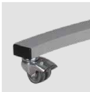
Leichtlaufende, feststellbare Rollen Smooth running & lockable castors