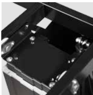
Klappmechanismus Tilt function