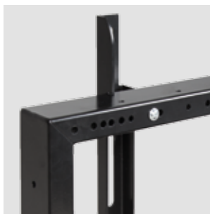
Aushängesicherung Screen secured by screws