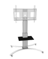
Vordere Ablage Blech schwarz für CCE-...