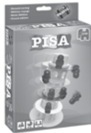
Pisa Reiseditie 12679