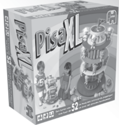
Pisa XL 17646

Kijk voor een compleet overzicht van alle Jumbo spellen en verkoopadressen op: www.jumbo.eu