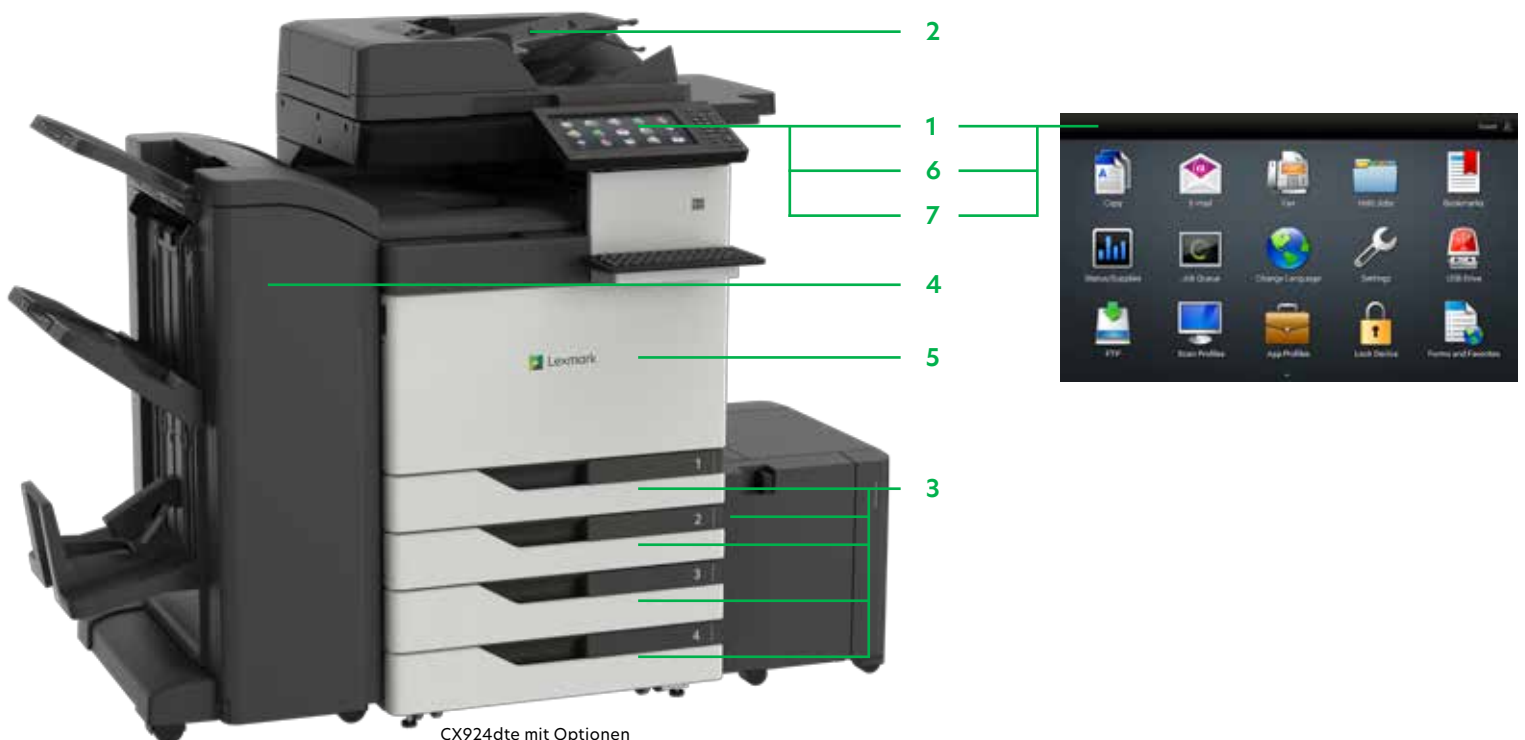
CX924dte mit Optionen

Drucken Sie Microsoft Office-Dateien, PDFs und andere Dokument- und Bildarten von Flash-Laufwerken oder wählen Sie Dokumente auf Netzwerk-Servern oder Online-Laufwerken aus und drucken Sie sie.