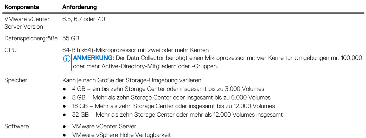
Tabelle 10. Storage Manager Virtuelle Appliance – Anforderungen (fortgesetzt)

Die folgende Tabelle zeigt die Anforderungen für Storage Manager Server Agent an.