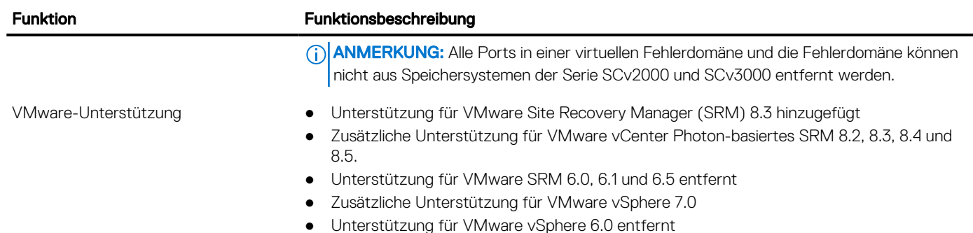
Tabelle 3. Geänderte Funktionen in Storage Manager 2020 R1 (fortgesetzt)