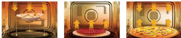
Sophisticated "Browning" top grill

The "Triple heating system" offers three different grill types so that you can choose how crisp & brown you prefer your meats or bakes goods to be.