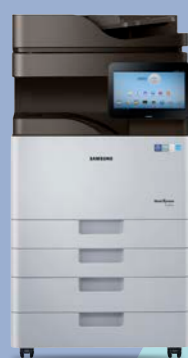
K4350LX (35 ppm)