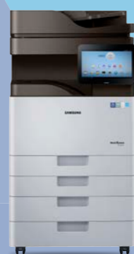
K4300LX (30 ppm)