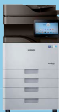
K4250RX (25 ppm)