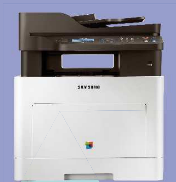
C3060ND (30 ppm)