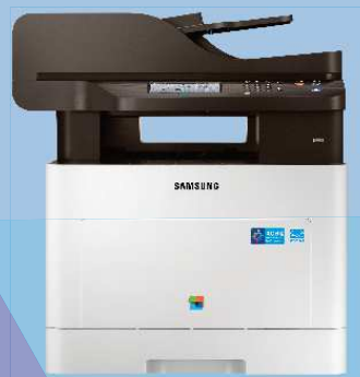
C3060FR (30 ppm)