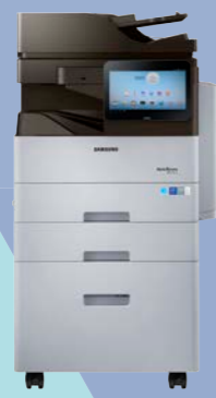
M5370LX (53 ppm)