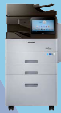
M4370LX (43 ppm)