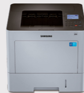
M4530ND (每分钟打印多至45页)