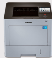
M4530NX (每分钟打印多至45页)