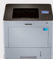
M4530ND (每分钟打印多至45页)