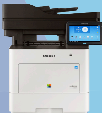
C4062FX* (40 ppm)

*Solo disponible en Norteamérica y Latinoamérica