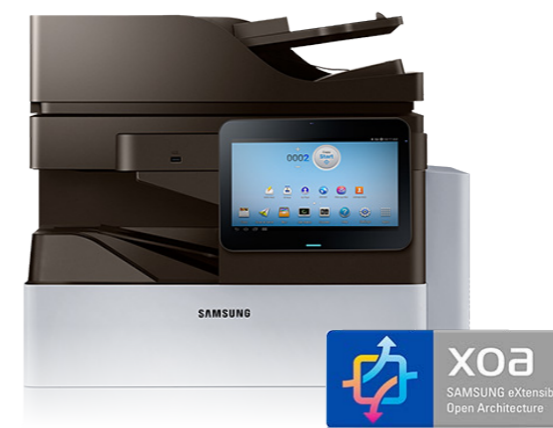
Cartuccia toner Max 30.000 pagine