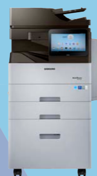
M4370LX (43 ppm)