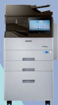
M5370LX (53 ppm)