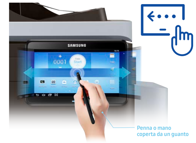
Penna o mano coperta da un guanto

La stampante SMART MultiXpress M5360RX è dotata di un pannello interattivo a sfioramento a infrarossi da 7 pollici che consente l'accesso a Smart UX Center. Include svariate funzionalità intelligenti, è facile da utilizzare ed è totalmente personalizzabile. L'eccezionale sensibilità consente agli utenti di sfruttare pienamente tutte le funzioni anche con una penna o con la mano coperta da un guanto.