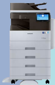
Alimentazione secondo cassetto + Supporto basso