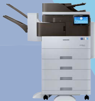
Finitore interno (2 vassoi) + Alimentazione secondo cassetto + Supporto basso