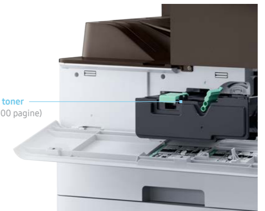
Cartuccia toner (Max 30.000 pagine)

Riduzione dei costi di manutenzione per elevati volumi di stampa, con cartucce di toner e tamburi a resa ultraelevata. I toner originali Samsung riducono i costi di gestione grazie all'elevato rendimento standard (30.000 pagine in bianco e nero) e ai tamburi che durano 100.000 pagine. I toner originali sono realizzati appositamente per le stampanti Samsung per cui garantiscono una qualità di stampa eccezionale e riducono gli sprechi di carta.