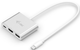
i-tec USB-C 3.1 HDMI and USB Adapter + Power Delivery P/N: C31AHDMIPD