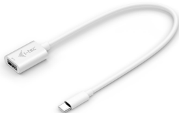
i-tec USB-C 3.1 Adapter P/N: C31ADA