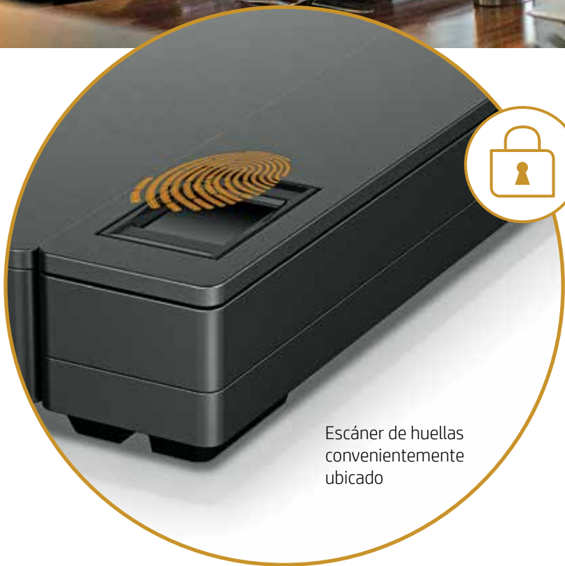
Escáner de huellas convenientemente ubicado