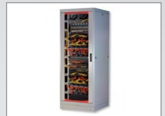
Esempio di Applicazione