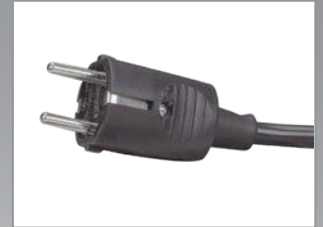
Spina standard CEI-23-16

Multipresa, barra di alimentazione installabile a rack; permette di collegare ed alimentare i dispositivi installati all'interno degli armadi 19" destinati a uffici, aziende, sale server, etc.