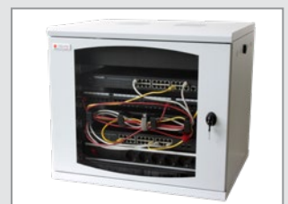
Esempio di Applicazione

Cod.: I-CASE STRIP-18A Multipresa 8 vie con cavo da 1.8 m