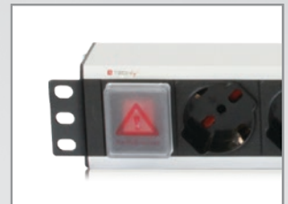
Coperchio per Interruttore