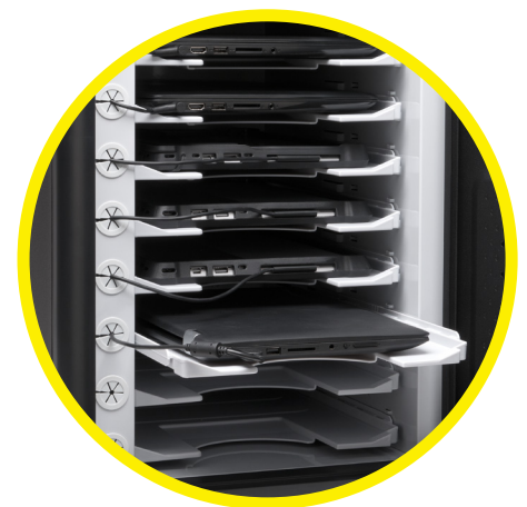
Coffre de chargement sécurisé AC12 K64415EU

POUR OBTENIR DES INFORMATIONS SUPPLÉMENTAIRES :