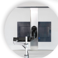
R-GO HYGIËNISCH VEILIGHEIDSSCHERM