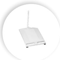
R-GO MORELIA DOCUMENTENHALTER