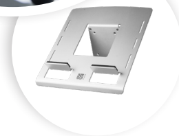
R-GO MORELIA LAPTOP-HALTERUNG