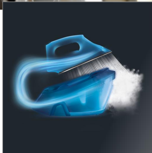
LIBERTY VR5020 VR5020F0