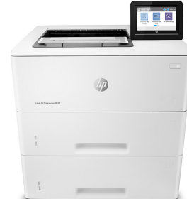
HP LaserJet Enterprise M507x

Dynamic-Security-fähiger Drucker. Ausschließlich für die Verwendung mit Patronen mit Original HP Chip vorgesehen. Patronen mit Chips anderer Hersteller funktionieren möglicherweise nicht oder in Zukunft nicht mehr. Weitere Informationen unter: