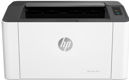
Impresora HP Laser 107a

Obtén un rendimiento de impresión productivo a un precio asequible. Obtén resultados de gran calidad, e imprime y escanea desde tu teléfono. 1,2