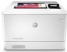
HP Color LaserJet Pro M454dn

Geschäftlich erfolgreich zu sein bedeutet, smarter zu arbeiten. Der HP Color LaserJet Pro M454 Drucker ist dafür konzipiert, dass Sie Ihre Zeit dort einsetzen können, wo Sie die höchste Effizienz beim Ausbau Ihres Geschäfts erzielen können und Ihren Vorsprung vor der Konkurrenz sichern können.