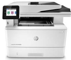
Stampante multifunzione HP LaserJet Pro M428fdn

Un business di successo è frutto di un modo di lavorare intelligente. La multifunzione HP LaserJet Pro M428 è progettata per consentirvi di concentrarvi su ciò che fa crescere efficacemente il vostro business e restare sempre un passo avanti rispetto alla concorrenza.