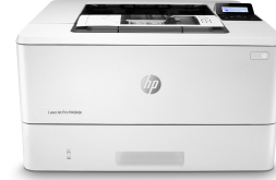
HP LaserJet Pro M404dn

Denne printer er kun beregnet til at fungere med patroner, der har en ny eller genbrugt HP-chip, og den bruger dynamiske sikkerhedsforanstaltninger til at blokere patroner med en ikke-HP-chip. Regelmæssige firmwareopdateringer opretholder effektiviteten af disse foranstaltninger og blokerer patroner, der tidligere har fungeret. En genbrugt HP-chip muliggør brug af genbrugte, genfremstillede og genopfyldte patroner. Flere oplysninger på: http://www.hp.com/learn/ds