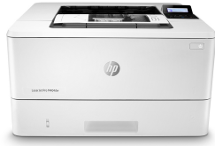
HP LaserJet Pro M404dw

I forretningslivet vinder du ved at arbejde smartere. HP LaserJet Pro M404-printeren er designet til, at du kan fokusere din på det, der er mest effektivt, så du kan skabe vækst i din virksomhed og være foran konkurrenterne.