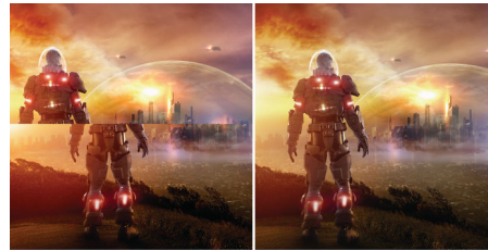
AMD FreeSync™ OFF (par défaut)