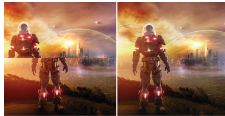
AMD FreeSync™ OFF (simulación)