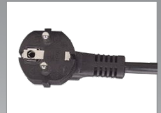
Spina Schuko angolata

Multipresa, barra di alimentazione installabile a rack; permette di collegare ed alimentare i dispositivi installati all'interno degli armadi 19" destinati a uffici, aziende, sale server, etc.