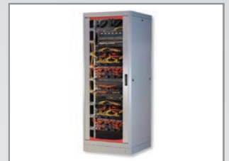
Esempio di Applicazione