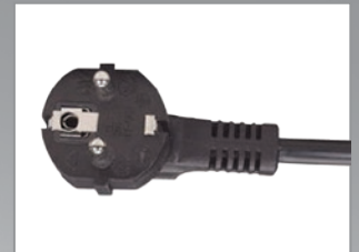
Spina Schuko angolata

Multipresa, barra di alimentazione installabile a rack; permette di collegare ed alimentare i dispositivi installati all'interno degli armadi 19" destinati a uffici, aziende, sale server, etc.