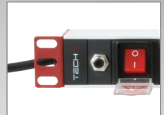
Protezione da sovraccarico