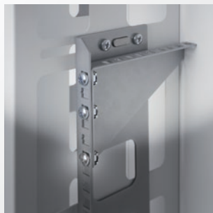
Cod. I-CASE RAIL-3UV Staffa da tre unità per installazione verticale