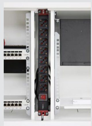
Sezione da 1U verticale con multipresa 19" installata