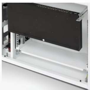
Cod. I-CASE TRAY-150WH Mensola 19" 1U forata profonda 150 mm RAL9016