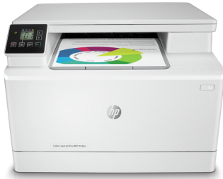
Impresora multifunción HP Color LaserJet Pro M182n

Una impresora multifunción inalámbrica y eficiente con fax para obtener un color de alta calidad. 2,1 Ahorra tiempo con Smart Tasks en la aplicación HP Smart, e imprime y escanea desde tu teléfono. 3 Obtén conexiones integrales y funciones de seguridad esenciales para mantener la privacidad y el control.