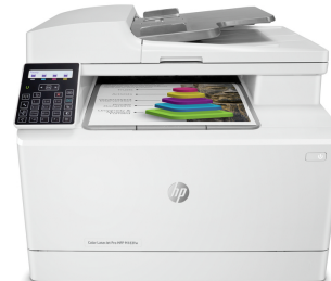
Impresora multifunción HP Color LaserJet Pro M183fw

Esta impresora está diseñada para funcionar solo con cartuchos que dispongan de un chip de HP nuevo o reutilizado, y utiliza medidas de seguridad dinámica para bloquear los cartuchos que usan un chip que no sea de HP. Las actualizaciones periódicas de firmware mantienen la eficacia de estas medidas y bloquean los cartuchos que funcionaban anteriormente. Un chip de HP reutilizado permite el uso de cartuchos reutilizados, rellenados o reacondicionados.