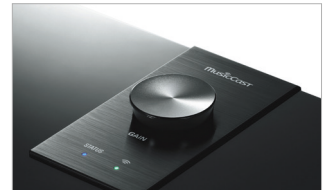
caisson laqué avec bouton de volume