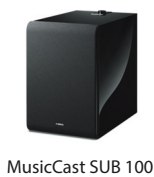
MusicCast SUB 100

La barre de son YMS-4080 est compatible avec le caisson MusicCast SUB 100 composé d'un haut-parleur de graves de 20 cm sur la partie latérale de l'ébénisterie, et qui produit un son puissant de 100 watts pour une restitution des graves riche, dynamique et enveloppante. Celui-ci est compatible avec les connexions sans fil et se présente dans un coffret étroit, compact pour une installation exceptionnellement souple.