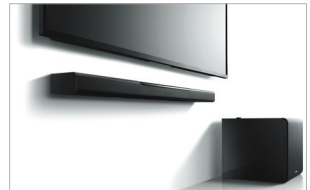
Possibilité de fixation murale