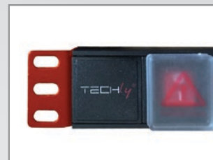
Coperchio per Interruttore