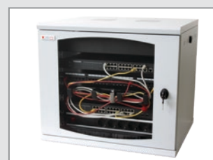
Esempio di Applicazione

Cod.: I-CASE STRIP-66U Multipresa 6 vie con cavo da 2 m