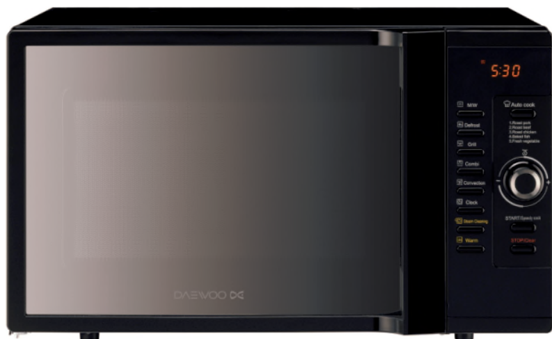
Finition noire avec porte miroir