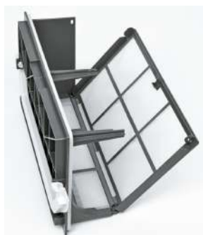
Filtre spécial condenseur

Le nettoyage du filtre du condenseur, à faire après chaque cycle, est plus facile et plus rapide.