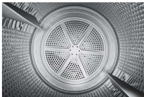
Vue intérieure du tambour