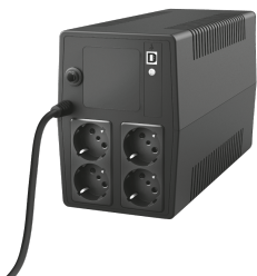
PRODUCT VISUAL 2