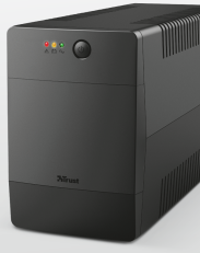
PRODUCT PICTORIAL 1