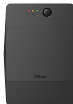
PRODUCT FRONT 1