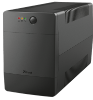
PRODUCT VISUAL 1