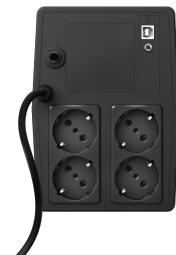
PRODUCT BACK 1