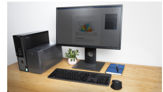
LIFESTYLE VISUAL 1