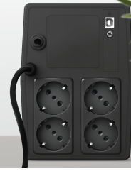
PRODUCT PICTORIAL 2

4 Battery and surge protected wall power outlets