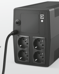
PRODUCT PICTORIAL 3