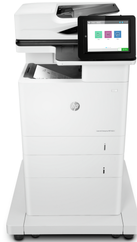
Stampante multifunzione Enterprise HP LaserJet M635fht