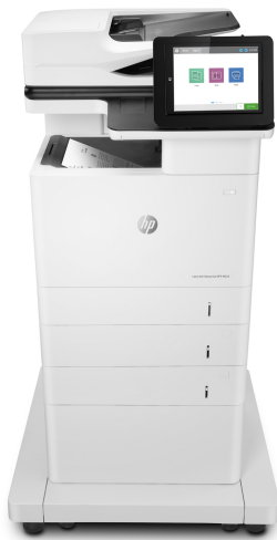
Stampante multifunzione Enterprise HP LaserJet Flow M635z

Questa multifunzione HP LaserJet con JetIntelligence coniuga eccezionali prestazioni ed efficienza energetica con stampa di documenti di qualità professionale proprio nel momento in cui ne avete bisogno, proteggendo la rete da attacchi con le più avanzate funzionalità di sicurezza del settore. 1