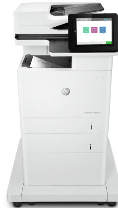
Impresora multifunción HP LaserJet Enterprise M635fht

Esta impresora está diseñada para funcionar solo con cartuchos que dispongan de un chip de HP nuevo o reutilizado, y utiliza medidas de seguridad dinámica para bloquear los cartuchos que usan un chip que no sea de HP. Las actualizaciones periódicas de firmware mantienen la eficacia de estas medidas y bloquean los cartuchos que funcionaban anteriormente. Un chip de HP reutilizado permite el uso de cartuchos reutilizados, rellenos o reacondicionados. Más información en: http://www.hp.com/learn/ds