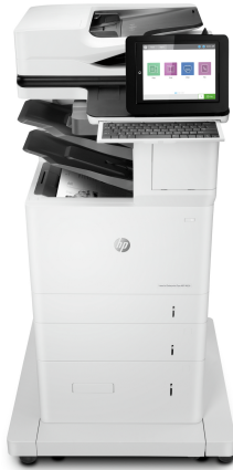
Impresora multifunción HP LaserJet Enterprise Flow M636z

Esta impresora multifunción HP LaserJet con JetIntelligence combina un rendimiento excepcional y la eficiencia energética con documentos de calidad profesional justo en el momento en que los necesita, protegiendo la red con la mayor seguridad del sector. 1