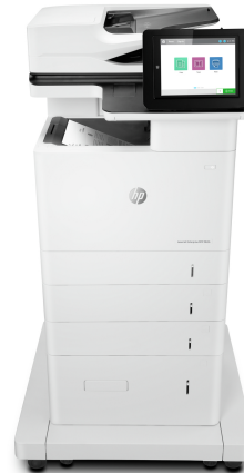
Impresora multifunción HP LaserJet Enterprise M636fh

Esta impresora está diseñada para funcionar solo con cartuchos que dispongan de un chip de HP nuevo o reutilizado, y utiliza medidas de seguridad dinámica para bloquear los cartuchos que usan un chip que no sea de HP. Las actualizaciones periódicas de firmware mantienen la eficacia de estas medidas y bloquean los cartuchos que funcionaban anteriormente. Un chip de HP reutilizado permite el uso de cartuchos reutilizados, rellenos o reacondicionados. Más información en: http://www.hp.com/learn/ds