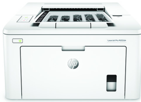
Stampante HP LaserJet Pro M203dn

Più pagine, prestazioni e protezione 1 dalla stampante wireless HP LaserJet Pro con cartucce toner JetIntelligence. Un ritmo più veloce per il vostro business: eseguite stampe fronte/retro; gestite le vostre attività per contribuire ad ottimizzare la vostra efficienza.