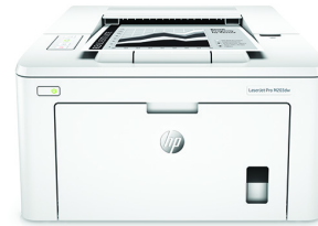
Stampante HP LaserJet Pro M203dw